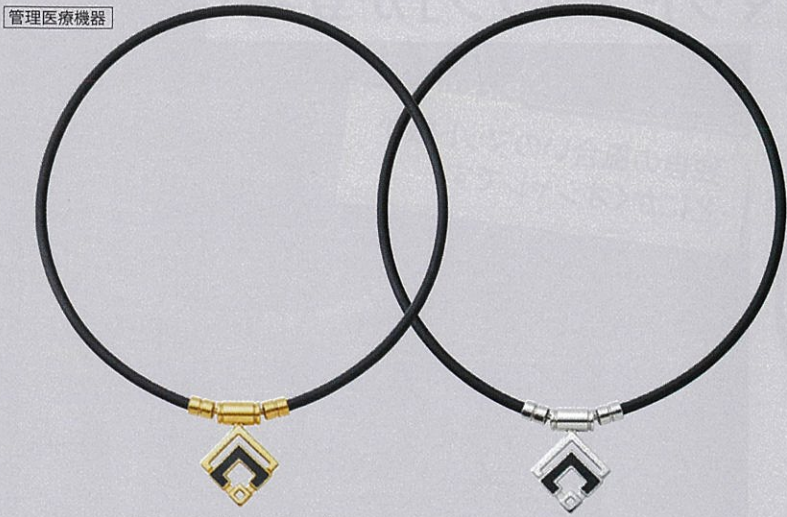
クラシックゴールド×ブラック シルバー×ブラック

コラントッテ TAO ネックレスα ARAN (アラン) 医療機器認証番号:226AGBZX00008A02